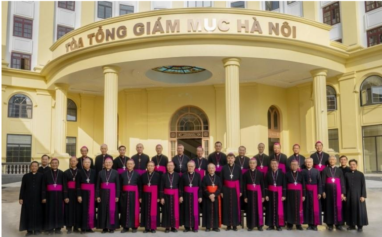
ĐẠI HỘI HỘI ĐỒNG GIÁM MỤC VIỆT NAM LẦN THỨ XV NĂM 2022