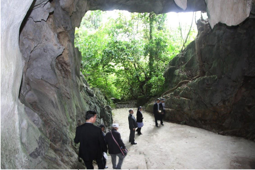
Ánh sáng cuối đường hầm