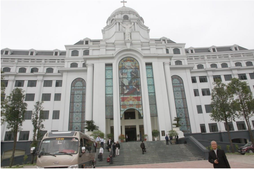
Trung tâm Mục vụ Giáo phận Hải Phòng