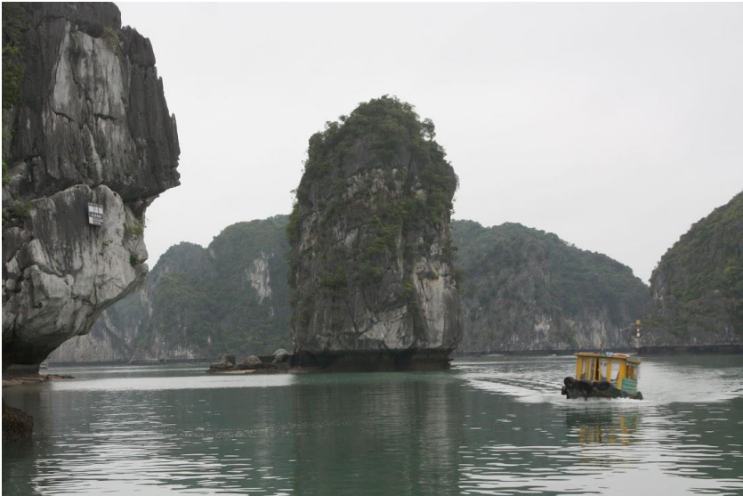
Vẻ đẹp Vịnh Lan Hạ