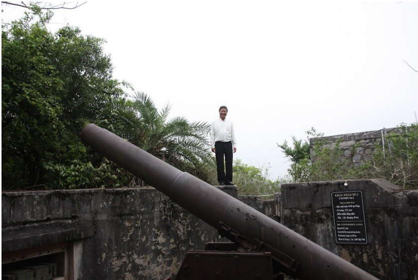
Pháo đài Thân Công