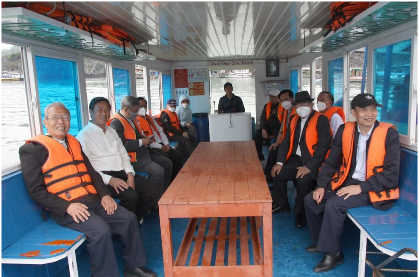
Lên đênh trên biển