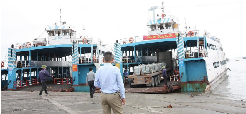
Phà Bến Gót