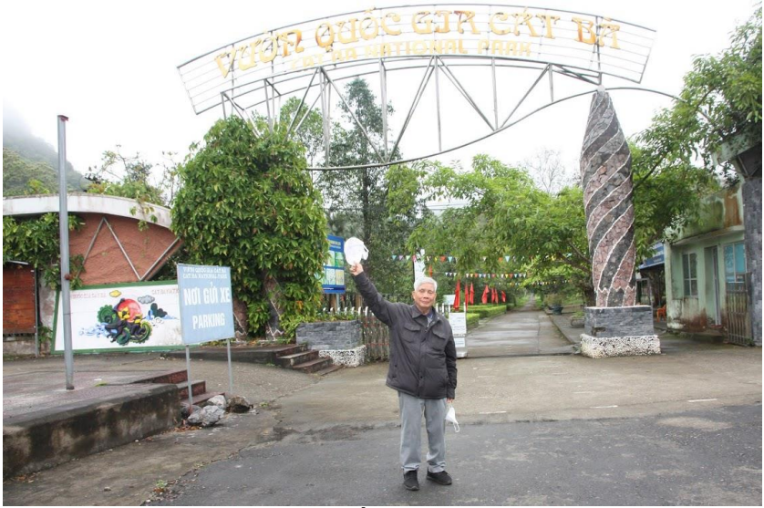
Vườn quốc gia Cát Bà