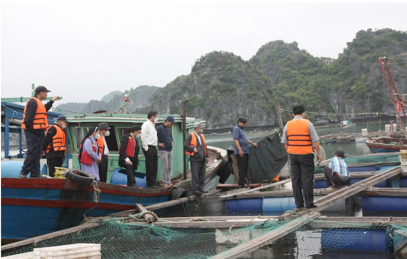
Thăm giáo dân sinh sống trên vịnh Lan Hạ