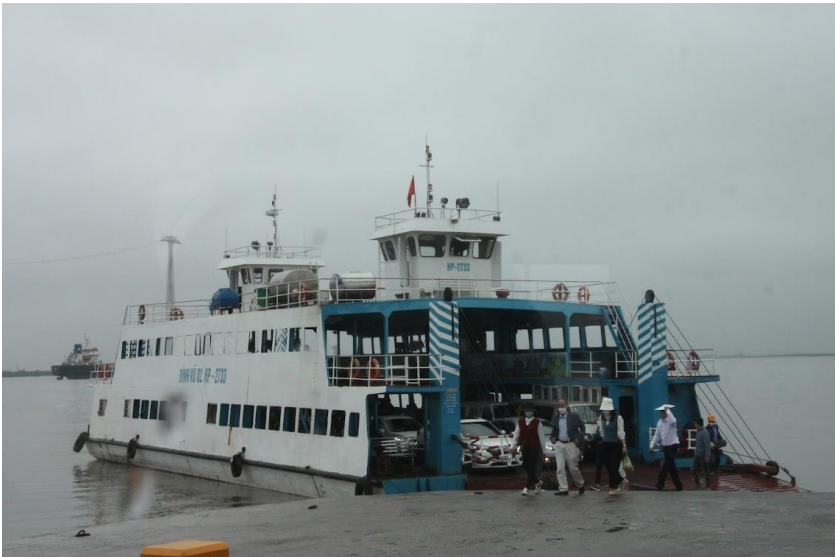
Rời đảo trên chuyến phà Đình Vũ