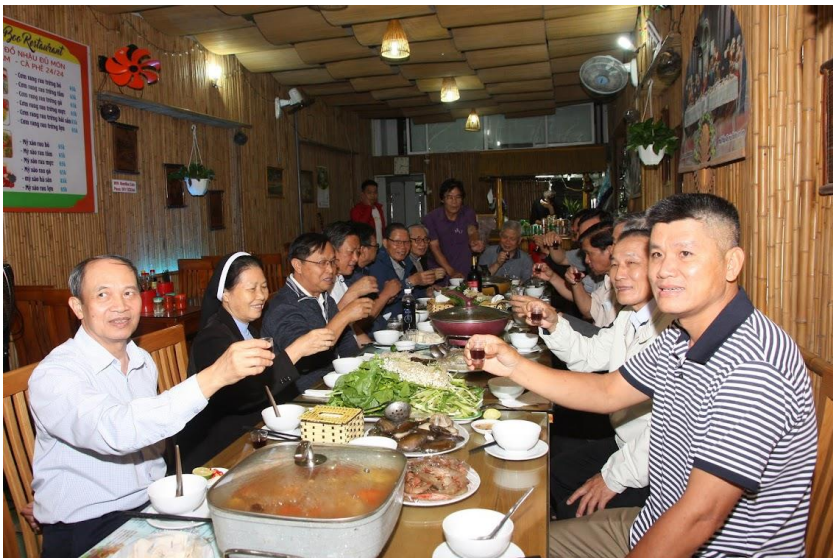
Bữa cơm tối thịnh soạn tại Cát Bà