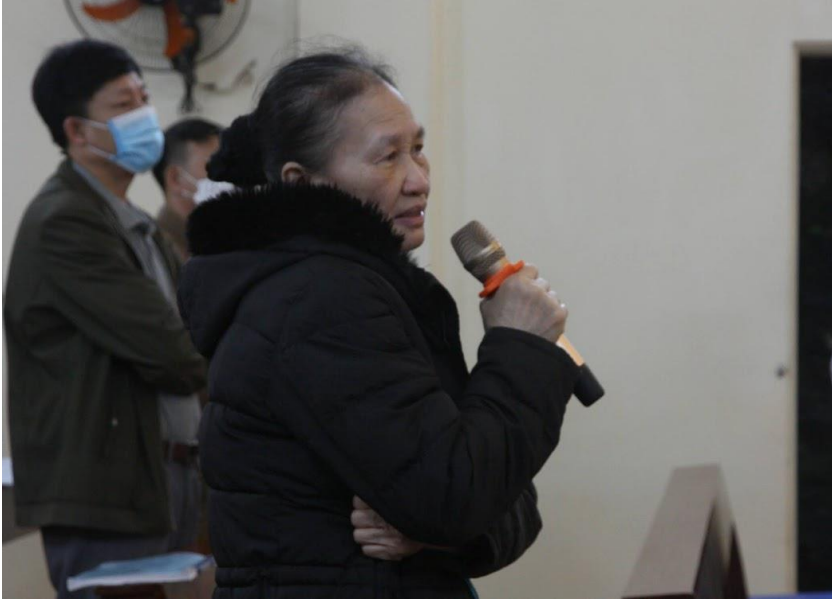
Bà chánh trương Giáo họ Cát Bà

Vườn Quốc gia chủ yếu là núi đá vôi có nhiều hang động, như: động Trung Trang, động Hoa Cương, động Thiên Long.