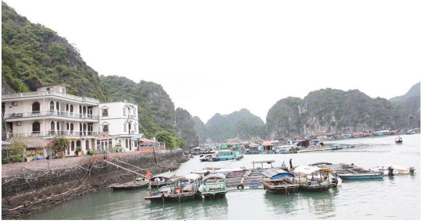
Bến Cai Bè