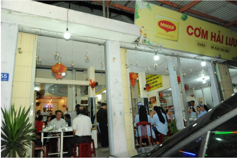
ăn trưa trên hành trình