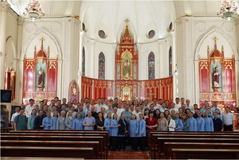
viếng Nhà thờ Chính tòa,