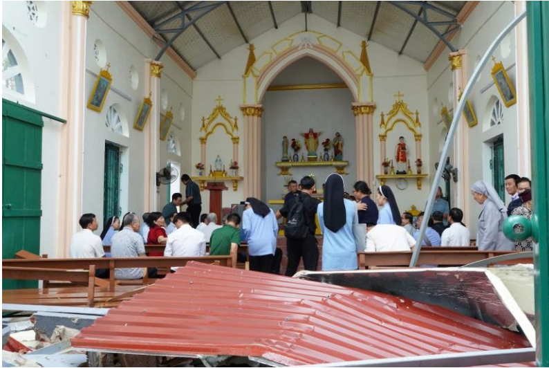
thăm Giáo họ Khuông Lư, Giáo xứ Mỹ Sơn -nơi Nhà thờ bị sập một phần mái tôn do cơn bão Yagi