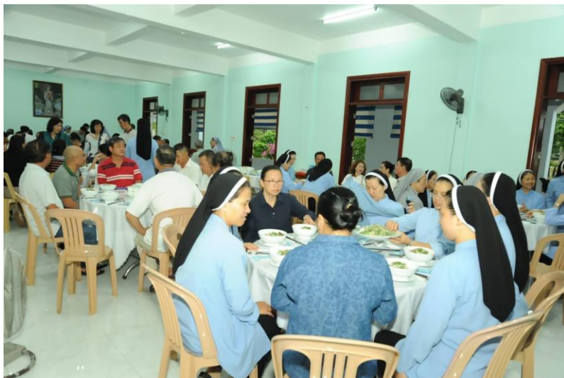
ăn sáng tại Trung tâm Thánh Mẫu La Vang