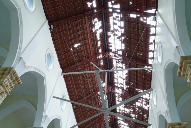
thăm Giáo xứ Sứ y Nèo -huyện Tiên Lãng