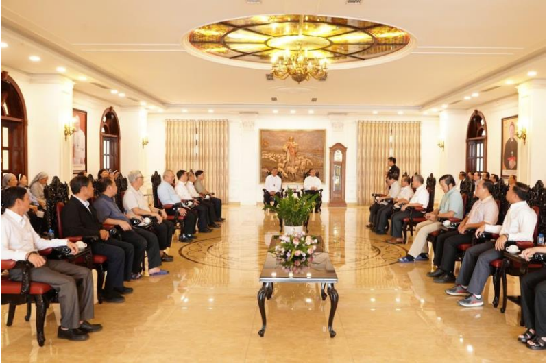
Hiệp hành với Đức Cha Vinh Sơn và “kết duyên” với Giáo phận Hải Phòng