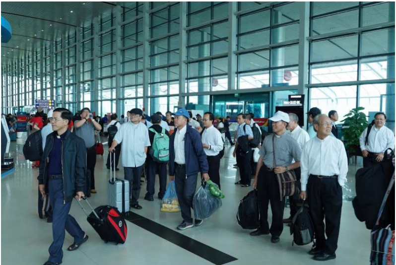
Một chuyến hành hương thật ý nghĩa. Tạ ơn Chúa!