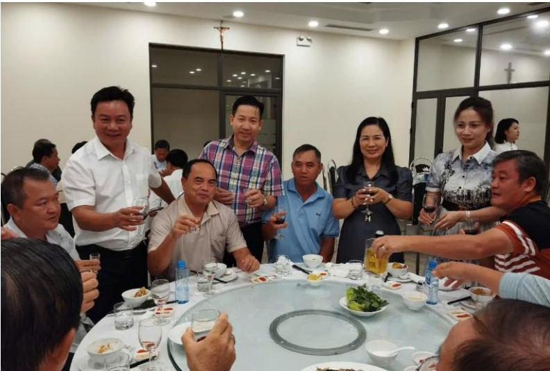
và chiêu đãi tiệc mừng thịnh soạn