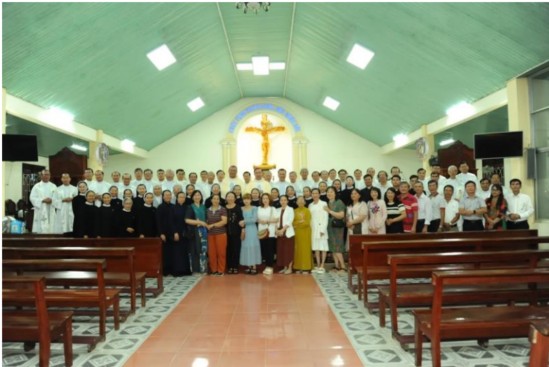
Thánh lễ Tạ ơn tại Nhà nguyện Đức Mẹ La Vang