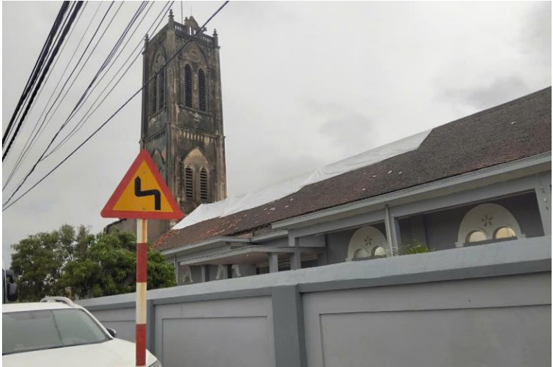
thăm Giáo xứ Văn Khê -huyện An Lão