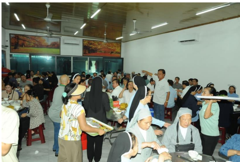
ăn trưa trên hành trình