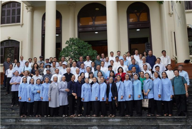
thăm Tòa giám mục Hải Phòng