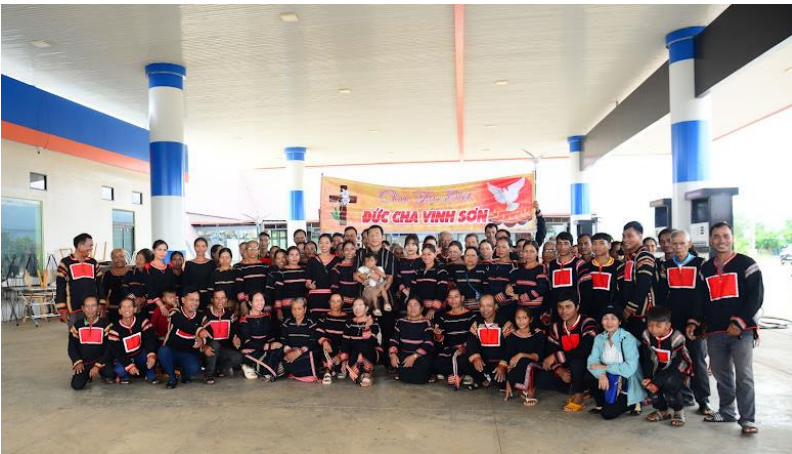
Giây phút chia tay Đức Cha nơi địa đầu Giáo phận