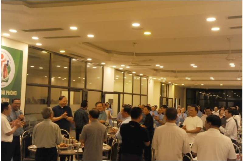
Ăn tối tại Trung tâm Mục vụ GP Hải Phòng