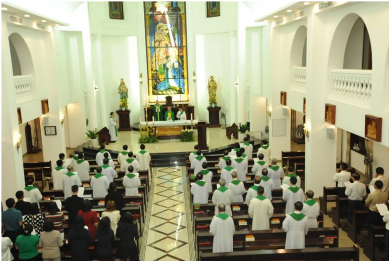
Thánh lễ Tạ ơn tại nhà nguyện Truyền Tin ở tầng 6 TTMV