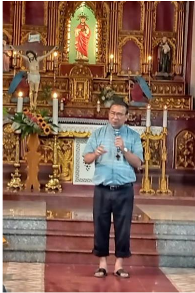
thăm Giáo xứ Văn Khê -huyện An Lão