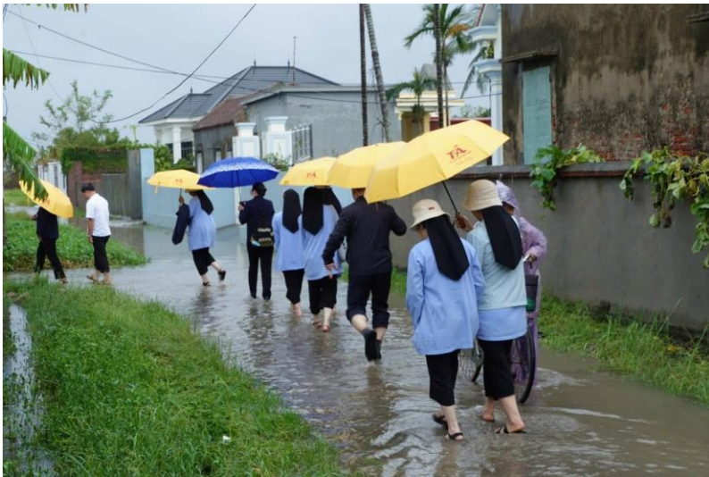
thăm Hiệp Hội Con Đức Mẹ Thừa sai Tin Mừng Hải Phòng